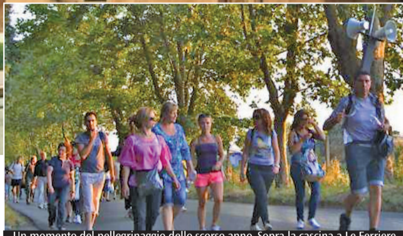
Un momento del pellegrinaggio dello scorso anno. Sopra la cascina a Le Ferriere

ricorda a testimonianza di autentica misericordia: «È commovente – si legge nel messaggio del Papa – il fervore con il quale Marietta si preparò a ricevere per la prima volta l'Eucaristia e con cui, in seguito, si accostava alla mensa eucaristica. Anche se, vista la situazione dei luoghi e le circostanze della sua vita, si poté cibare di Cristo solo altre poche volte, senza questa forza non avrebbe potuto compiere la scelta fondamentale della sua breve esistenza. Mi piace oggi porre in evidenza che, nel momento in cui, ferita a morte, compì la scelta suprema della sua vita, Marietta non pensava più a se stessa, ma a proteggere chi la colpiva a morte. Conosciamo pure le parole di perdono che ella ebbe per lui; sul letto di morte, al cappellano dell'ospedale di Nettuno, disse: "Lo perdono e lo voglio con me in paradiso". Nella bolla Misericordiae Vultus ho sottolineato che il perdono diventa l'espressione più evidente dell'amore misericordioso e per noi cristiani è un imperativo da cui non possiamo prescindere».