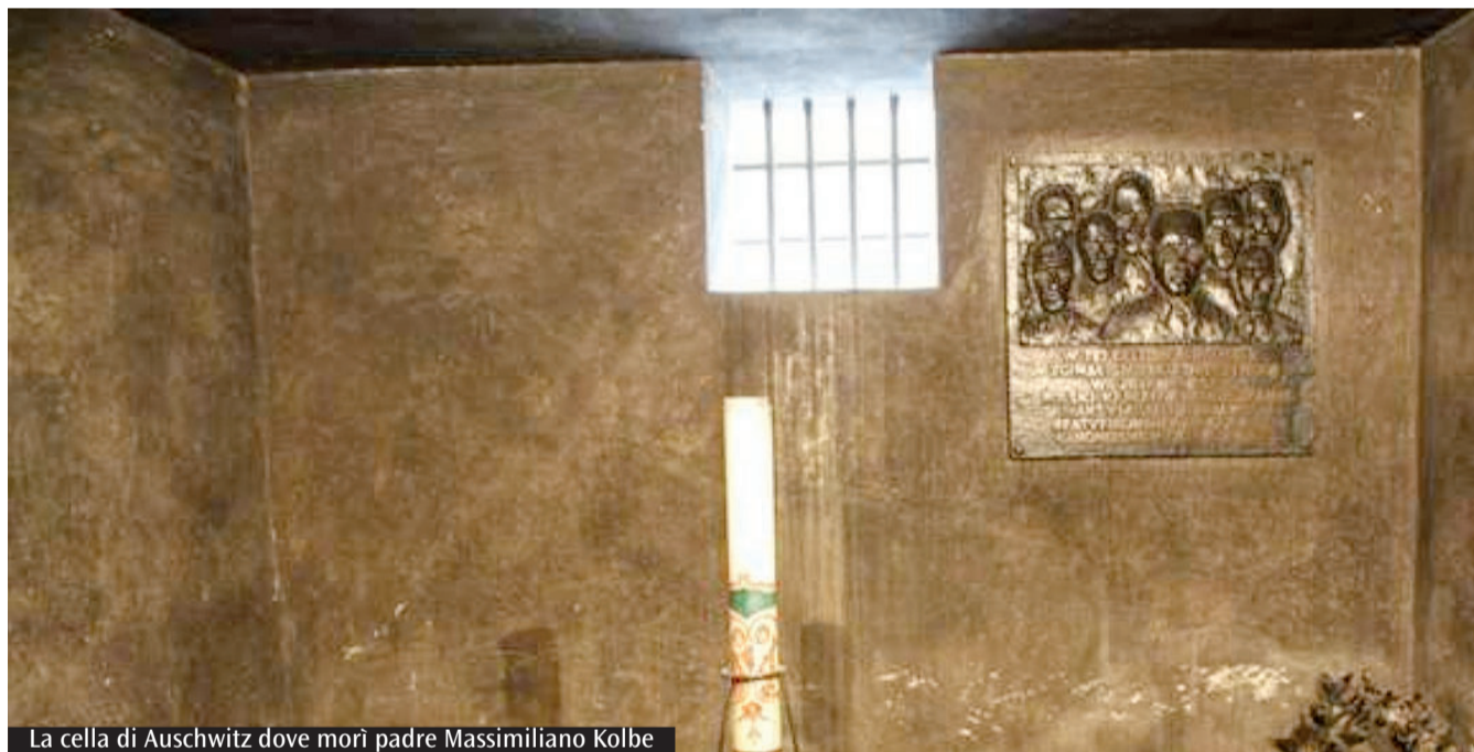
La cella di Auschwitz dove morì padre Massimiliano Kolbe

sua razione di patate per la cena dei suoi fratelli. L'intuizione della stampa come mezzo di comunicazione che forma la mentalità e le coscienze delle masse, lo porterà a fondare il più grande complesso editoriale, e