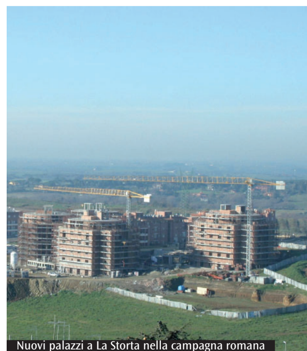
Nuovi palazzi a La Storta nella campagna romana