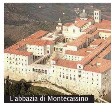
L'abbazia di Montecassino

immaginario percorso nei luoghi che hanno accolto il Santo Patrono d'Italia, attraverso le città e i Monasteri che furono teatro del suo apostolato e che ne conservano la memoria. E infine I Silenzi della via Francigena, l'antico