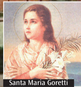
Santa Maria Goretti