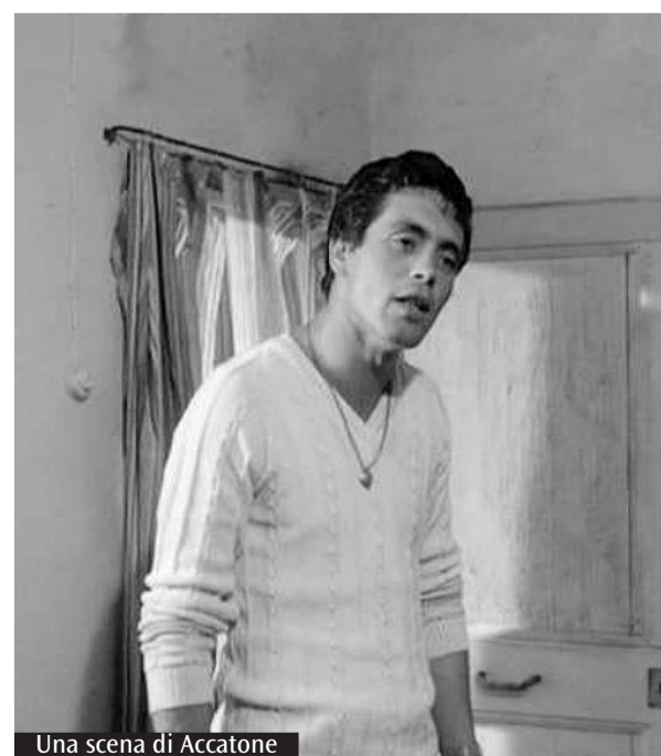
Una scena di Accatone