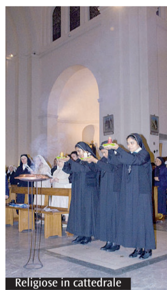
Religiose in cattedrale