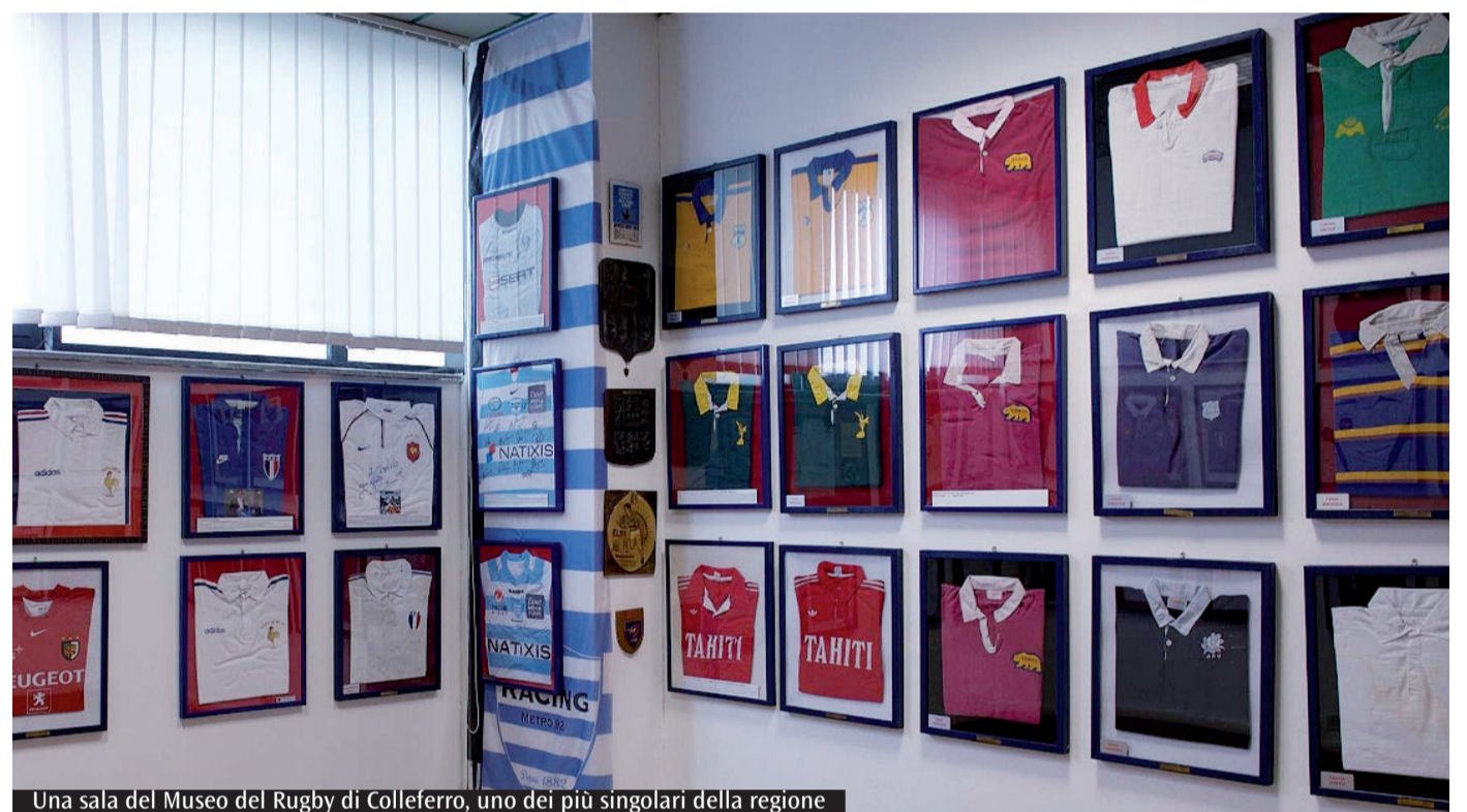
Una sala del Museo del Rugby di Colferro, uno dei più singolari della regione