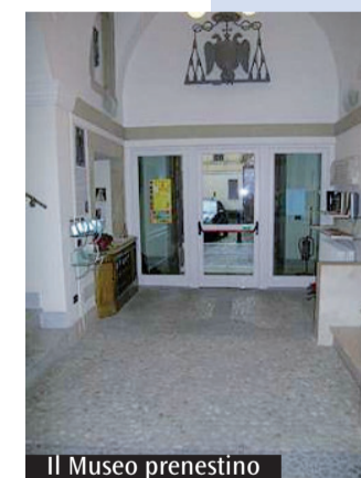
Il Museo prenestino

e inclusiva attraverso la competitività del settore, la circolazione transnazionale delle opere e degli operatori culturali, il rafforzamento della capacità finanziaria dei settori coinvolti per favorire innovazione e nuovi modelli di business. Europa Creativa inoltre sostiene la traduzione e la promozione di opere letterarie attraverso i mercati dell'Ue e supporta festival cinematografici per la realizzazione di film europei. Dal 2016 includerà anche uno strumento di garanzia di 121 milioni di euro per agevolare l'accesso ai finanziamenti da parte dei settori culturali e creativi. (S.D.V.)