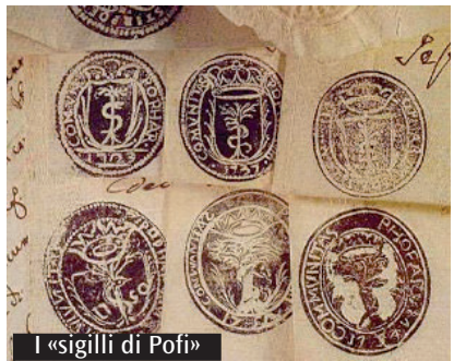
I «sigilli di Pofi»