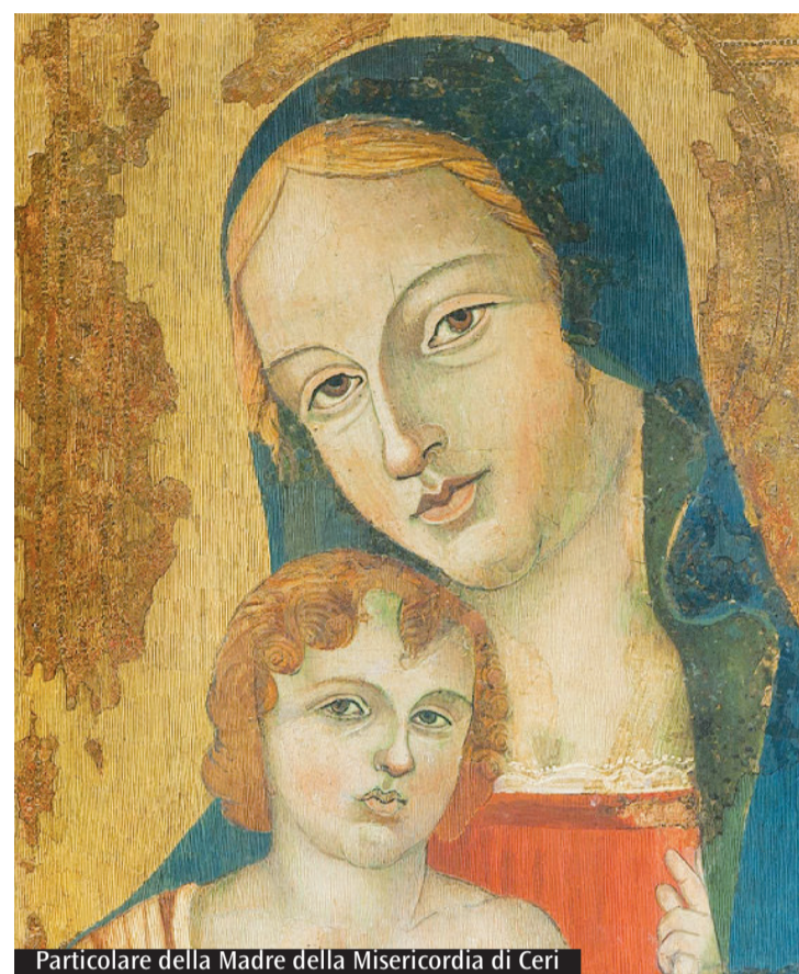
Particolare della Madre della Misericordia di Ceri

Gli uffici della curia vescovile di Porto-Santa Rufina rimangono aperti fino a mercoledì 23 dicembre compreso; riaprono dopo le ferie per il Santo Natale lunedì 4 gennaio 2016. Gli uffici del Centro Caritas diocesano Santi Mario, Marta e figli di Ladispoli, compreso il centro d'ascolto, resteranno chiusi il 25 e 26 dicembre e l'1 e 6 gennaio.