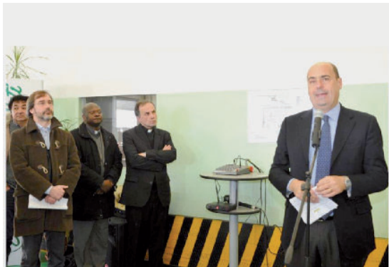
Sopra: il governatore Zingaretti con il vescovo Pompili all'inaugurazione dello stabilimento Elexos. A fianco: il ministro Guidi al teatro Vespasiano di Rieti