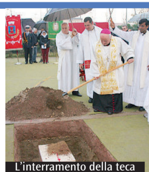
L'interramento della teca