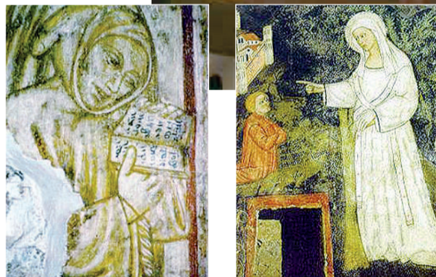
In alto la cappella del presepe a Greccio, costruita davanti alla grotta dove San Francesco nel Natale del 1223 allestì la prima rappresentazione della nascita di Gesù. Qui sopra due degli affreschi della chiesa di Leonessa intitolata al «Powerello» di Assisi

diceva lui dalla "Pompa del Mondo" che lo sconvolse, compose il messaggio d'amore più bello della storia d'Occidente. In mezzo ad una foresta, su di un crinale della conca reatina. Il Natale del 2015, quello dell'Anno Santo, lascia qui la sua scia. Lo fa con la scelta di Bergoglio di farsi portatore, con la sua umiltà, del messaggio di Francesco. Quel messaggio passato prima da questi luoghi impervi del Lazio orientale, in mezzo ai faggi, dove Francesco con le sue "creature" visse più di qualche anno. Greccio ci porta dritti dentro il Natale di quest'anno, di tutti i cristiani che vedono nella mangiatoia quella forza di Gesù che si è fatto uomo, e che vide i "Magi" dalla terra di Persia raggiungere Betlemme. Il Natale di quest'anno è forse questo. Proviamo a viverlo anche attraverso la figura del santo, facendo un salto nella Valle Santa reatina, su quel cammino.