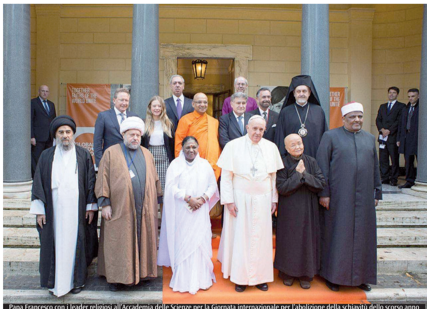
Papa Francesco con i leader religiosi all'Accademia delle Scienze per la Giornata internazionale per l'abolizione della schiavitù dello scorso anno