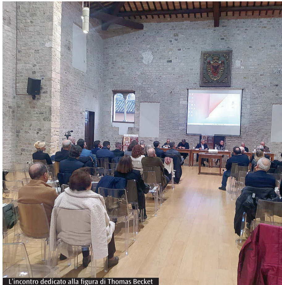
L'incontro dedicato alla figura di Thomas Becket

* direttore commissione pastorale sociale e lavoro del Lazio