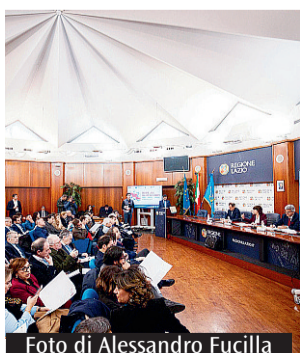
Dalla Regione Lazio in arrivo un pacchetto di provvedimenti che semplifica procedure e accesso ai fondi

Dalla Regione Lazio nuove misure dedicate ai professionisti. Il pacchetto di provvedimenti è stato illustrato nella Sala Tevere della Giunta regionale nel corso dell'evento "La Regione Lazio per i professionisti: normativa, opportunità, finanziamenti". L'iniziativa racchiude un pacchetto di interventi che prevede un aggiornamento delle normative regionali per rendere più agevole l'accesso ai finanziamenti, semplificando le procedure burocratiche e ampliando le categorie di professionisti beneficiari, con particolare attenzione ai giovani. Tra le iniziative presentate, uno specifico avviso pubblico per sostenere l'avvio delle attività dei giovani professionisti che sarà pubblicato a