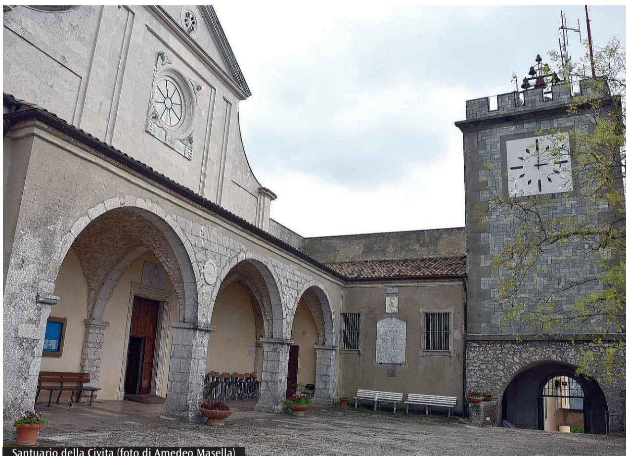
Santuario della Civita

territorio. Abbiamo promosso un piano di interventi per il miglioramento delle infrastrutture, la riqualificazione dei percorsi e l'adeguamento delle strutture di accoglienza e lanciato il progetto "Giubileo nel Lazio: Tradizioni, Saperi, Eccellenze", un'iniziativa per unire il patrimonio religioso e culturale della regione anche alle sue eccellenze enogastronomiche». Il primo appuntamento, oggi, 23 febbraio, nel Parco naturale dei Monti Aurunci, con partenza dal Rifugio Pomito, a Maranola (Latina). È dedicato alla riscoperta del Cammino di San Filippo Neri, un percorso ricco di storia e spiritualità che ricalca le tracce del pellegrinaggio del Santo della gioia e del sorriso, così la pietà popolare ama chiamare San