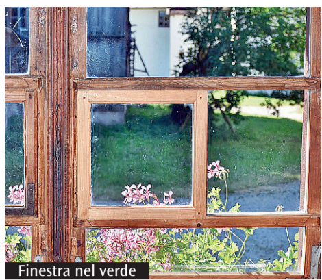
Finestra nel verde