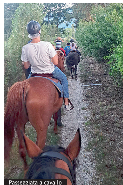
Passeggiata a cavallo

dell'offerta di alloggio, degustazione e ristorazione, che restano il core-business di queste strutture, con altre attività. Insomma, la cucina non basta più, e la maggior parte delle aziende agrituristiche del Lazio punta a offrire ai propri ospiti diversi tipi di esperienze. Sono 764 le aziende che, secondo i dati Istat, prevedono altre attività: corsi di equitazione (105), escursionismo (247), osservazioni naturalistiche (118), trekking (162), mountain bike (82), fattorie didattiche (88), corsi vari (168), attività sportive (164). Sono 540 le aziende che offrono "attività varie". Per quanto riguarda la conduzione delle aziende, infine, quelle gestite da uomini nel 2023 sono 739 (in aumento del 3,4% rispetto al 2022), mentre quelle gestite da donne 608 (in crescita del 6,9% rispetto al 2022).