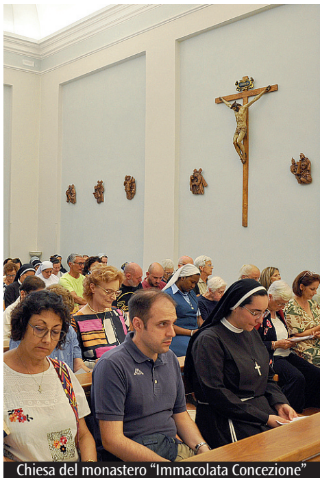
Chiesa del monastero "Immacolata Concezione"