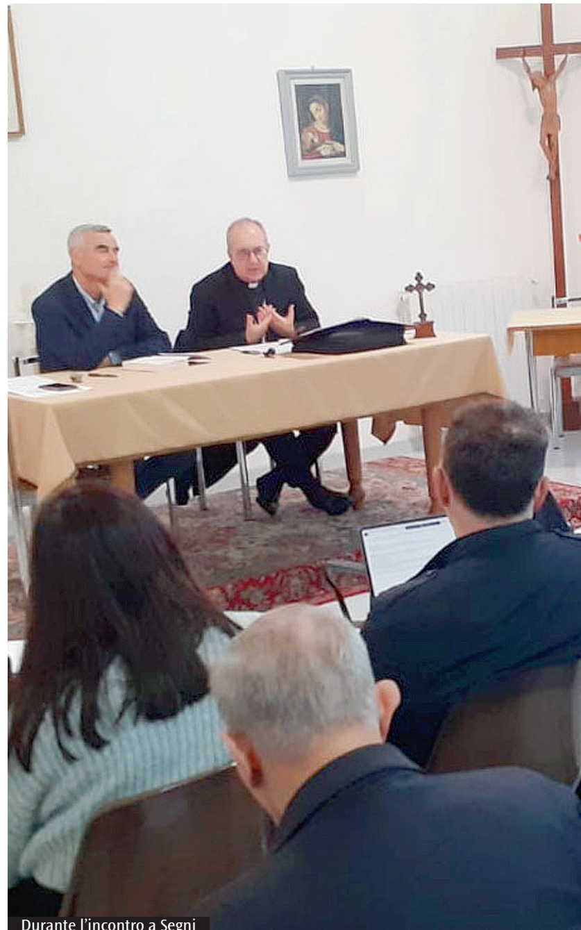
Durante l'incontro a Segni

Dopo le Settimane sociali le diocesi sono chiamate a proseguire quanto sperimentato a Trieste