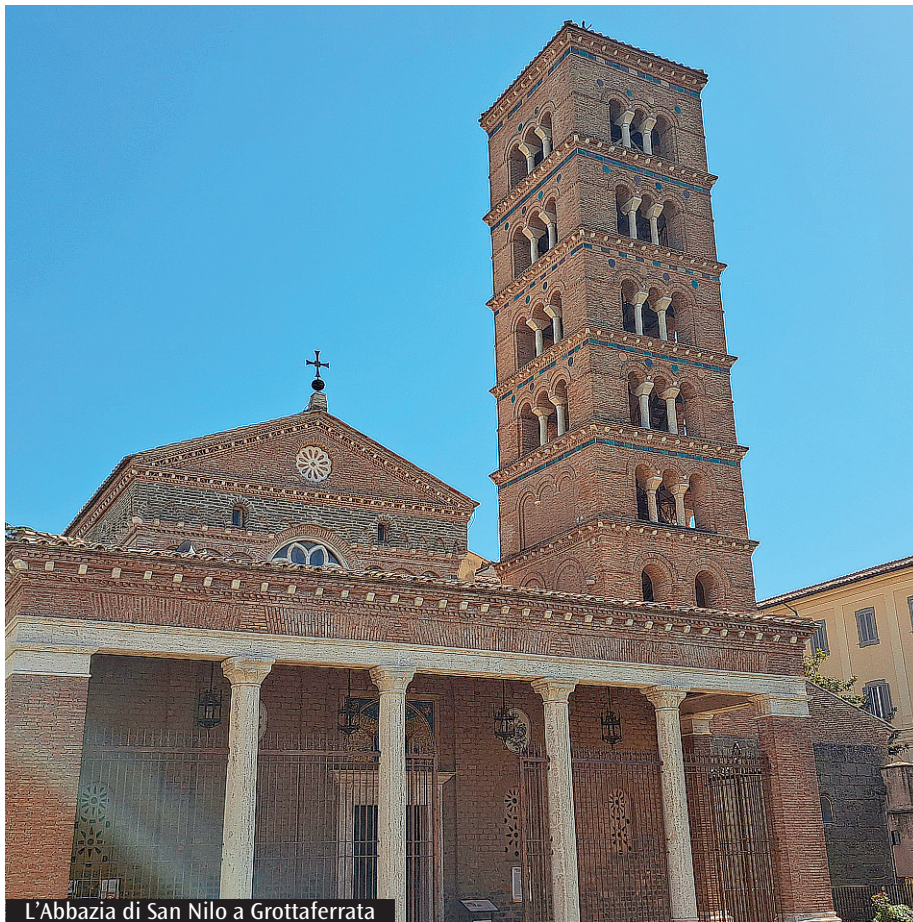
L'Abbazia di San Nilo a Grottaferrata

I prossimi appuntamenti del millenario saranno il 17 novembre con la rappresentazione teatrale sulla vita di San Nilo, il 13 e 14 dicembre il convegno sul tema "Storia e teologia dell'arte nella Basilica di Grottaferrata", con l'intervento di studiosi e storici dell'arte, il 14 dicembre un concerto di musica bizantina del coro polifonico "San Basilio il Grande" e il 17 dicembre con la solenne divina liturgia nel giorno in cui ricorrono i mille anni della Dedizione della Basilica di Santa Maria di Grottaferrata.