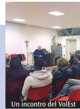
Un incontro del VolEst

sull'accentuarsi del fenomeno del bullismo e sottolineando la necessità di non rimanere in silenzio ma di informare i genitori, le scuole e le autorità competenti. Al termine della funzione la statua di San Giuseppe è stata riportata nella Chiesa parrocchiale di Santa Maria del Rosario. Non prima di aver affidato al Santo le preghiere e la necessità della città. «Perché sia lui – conclude Reali – a renderci più lineari, più luminosi nella nostra condotta e più consapevoli delle nostre responsabilità».