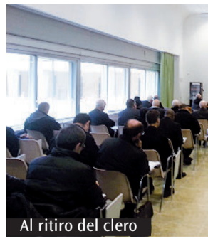
Al ritiro del clero

culturale e sociale. Ma l'esempio del nazareno che riesce a relazionarsi con ogni persona deve essere guida nel rapporto con chi proviene da culture differenti. L'accoglienza in questo senso, deve consistere prima di tutto nel dotare queste persone degli strumenti necessari per partecipare della vita sociale ed economica, come ad esempio la scolarizzazione e l'apprendimento di lingua e costumi. Infine il pensiero del vescovo va alla questione lavoro, che vede nel caso Alitalia un delle peggiori