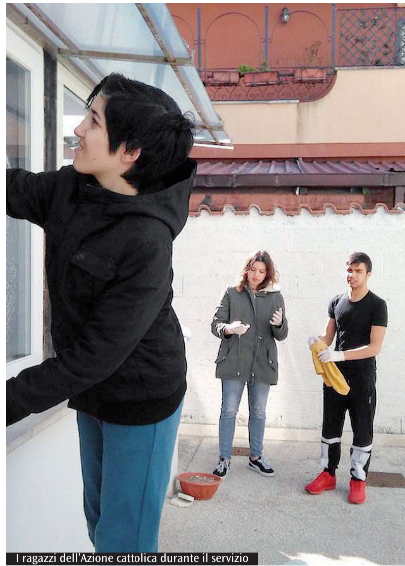
I ragazzi dell'Azione cattolica durante il servizio

1 APRILE VolEst 2017. Corso di formazione per volontari (vedi sotto) 4 APRILE Anniversario dell'autonomia di Fiumicino. 8 APRILE Veglia mariana dei giovani a Santa Maria Maggiore (Roma, ore 17). Si prega i parroci di comunicare le partecipazioni alla curia.