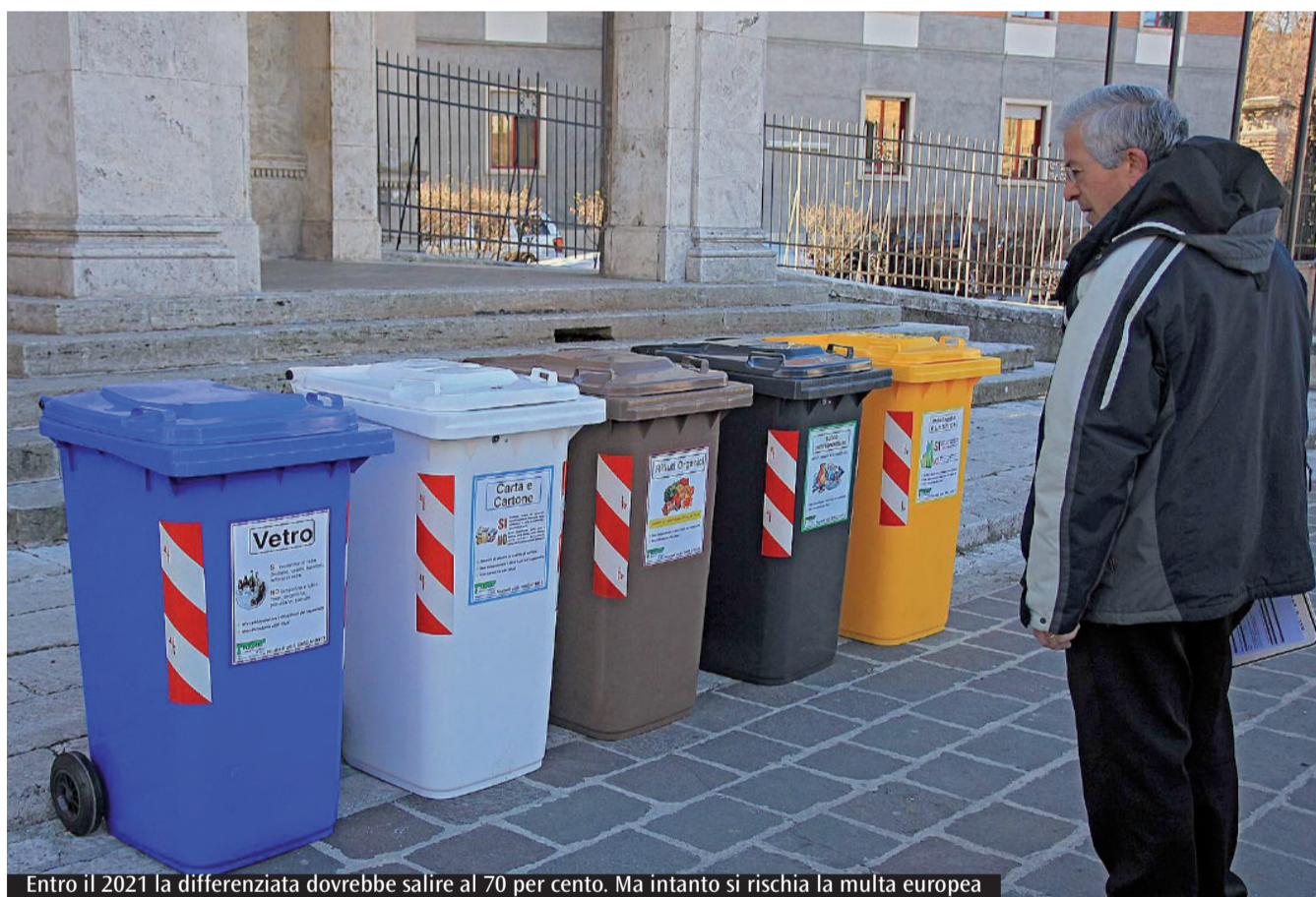
Entro il 2021 la differenziata dovrebbe salire al 70 per cento. Ma intanto si rischia la multa europea

Delle circa 3 milioni di tonnellate di Rsu prodotti nel Lazio 2 milioni provengono dal Roma, con una componente differenziata pari al 38,1%, quasi 900 tonnellate. Ma solo una porzione viene trattata nell'area romana per insufficienza impiantistica, quindi le amministrazioni ricorrono alla tasferenza in altri territori nazionali e internazionali. Da una parte la regione, che ha già dato un ultimatum al suo capoluogo per definire un piano coerente, dice che nel suo territorio, esclusa Roma, non c'è necessità di ampliare la dotazione di nuove discariche o strutture per il trattamento dei rifiuti inutilizzabili. E questo, dati alla mano, è ragionevole. È vero pure che gli amministratori regionali vogliono mantenere buone