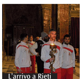
L'arrivo a Rieti

Di ritorno da Bruxelles, la fiaccola benedettina «Pro Pace et Europa Una» ha ripreso la sua marcia in Italia. I tedofori delle città di Norcia, Subiaco e Cassino, accompagnati dal Vice Sindaco di